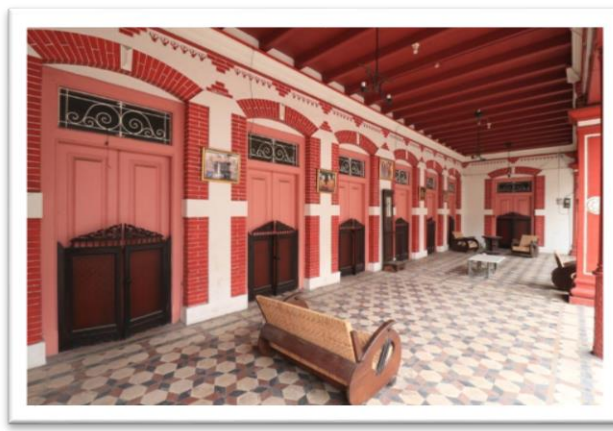
Gambar 1. Kampung Kemas Gresik